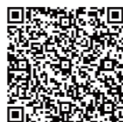
イノベーションデイズ 登録及び展示会のご案内動画