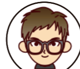
合同会社DMM.com 3Dprint事業部 事業部長 makeAKIA事業部 事業部長 ちゃんすけ部長