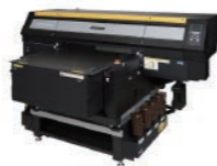
UJF-7151 plus II

コロナ禍にもまれてオーダーグッズ市場は様変わりしています。ニーズはますます多様化し、新たな売り手、作り手の登場により流通経路も変化を見せています。一方で、UVプリンターをはじめとする製造設備も技術革新によって進歩しました。しかしその進歩は、次々に変化し難易度も高まるオーダーグッズの消費者ニーズを満たせるのでしょうか？